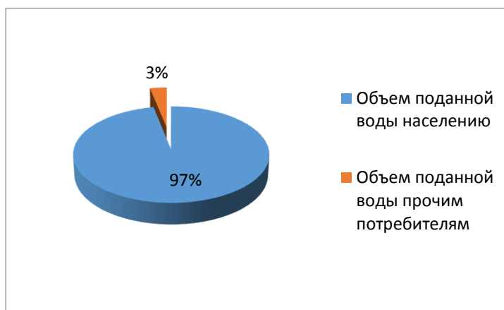
Рисунок 2 Фактическое потребление питьевой воды населением.

Оплата за потребленную воду производится ежемесячно, согласно показаниям приборов учета.